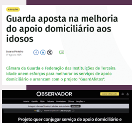
O Projeto GuardAfetos foi notícia em vários órgãos de comunicação social.